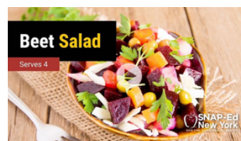
Ensalada de Remolacha