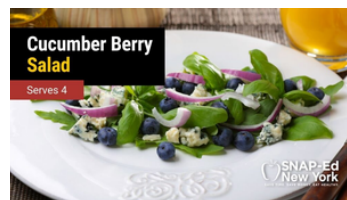
Ensalada De Pepino Y Bayas