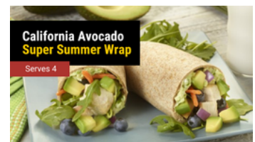
California Wrap de Verano con Aguacate